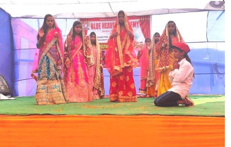
पर्सा जिल्लाका विभिन्न विद्यालयमा सरस्वती पूजा मनाइँदै।