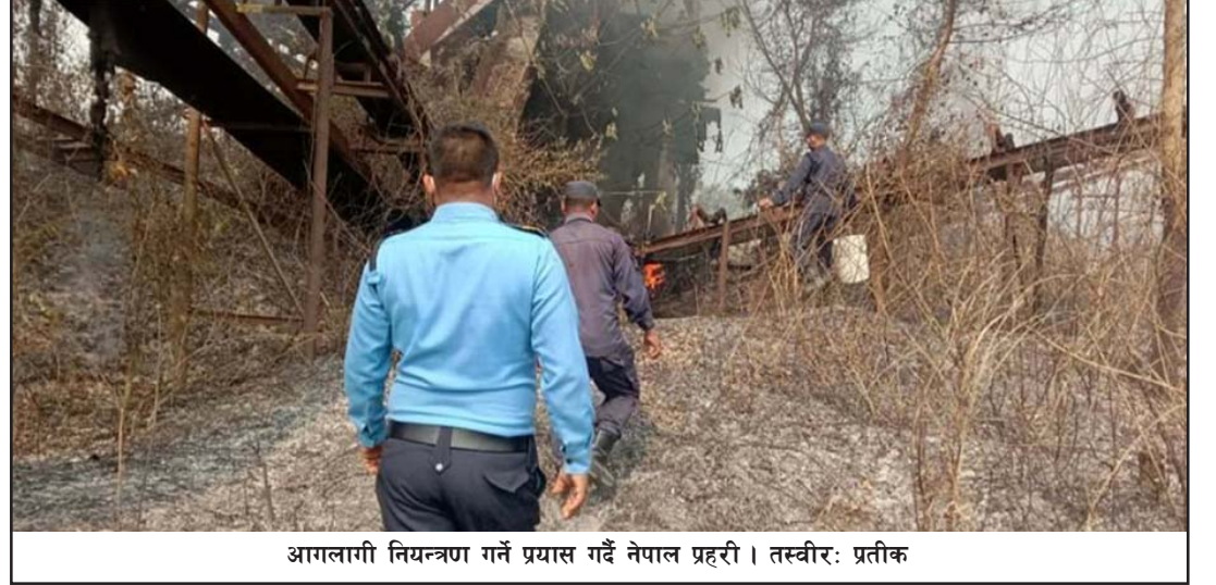
आगलागी नियन्त्रण गर्ने प्रयास गर्दै नेपाल प्रहरी ।

वारुणयन्त्रको मदतले करीब दुई घण्टापछि आगो नियन्त्रणमा आएको