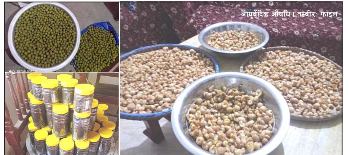
आयुर्वेदिक औषधि ।

मात्रामा कलेज नखोल्दा दक्ष जनशक्तिको अभाव छ भने भारतबाट पढेर आएका आयुर्वेदिक बि फर्मासिस्टहरूको लागि