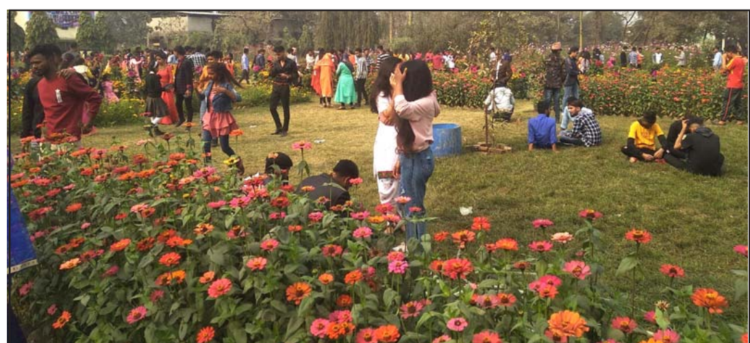
ठाराब क्याम्पस वीरगंजमा रमाइलो गर्दै विद्यार्थीहरू ।