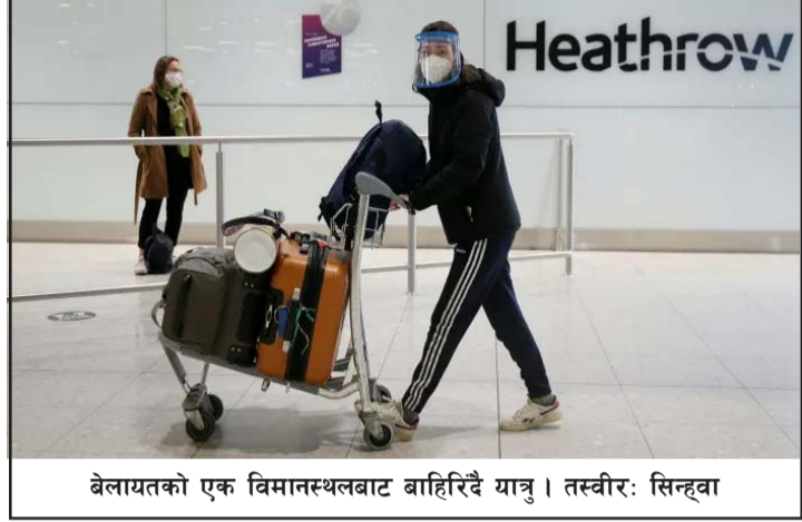
बेलायतको एक विमानस्थलबाट बाहिरिदै यात्रु।

मृतक तथा कोरोना सङ्क्रमितको सङ्ख्या पहिलेका तुलनामा केही कमी