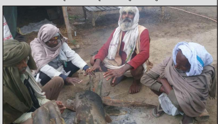
सिम्रौनगढमा घुर ताप्ले बुजुर्गहरू ।

प्रयोग गरिन्थ्यो । सिम्रौनगढ नगरपालिका-२ अमृतगंजका वृद्ध