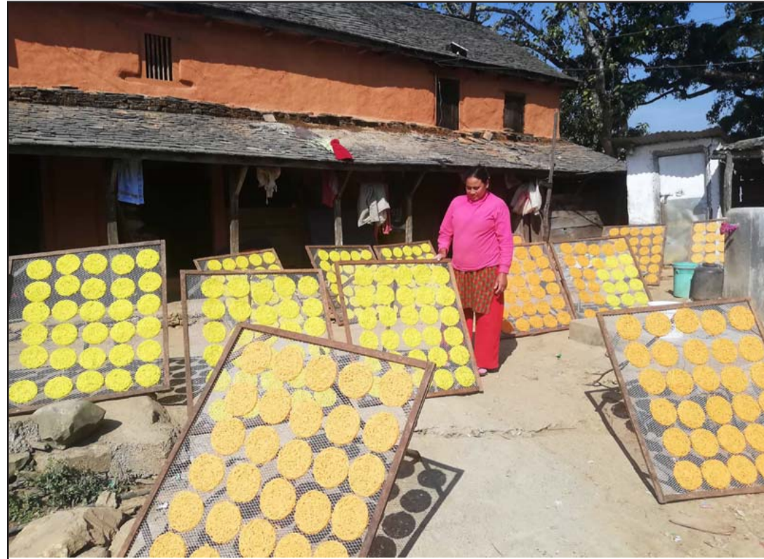
शिलिङ्गा सुकाउँदै : तनहुँको धिरिङ गाउँपालिका-५ मोहोरियाका महिला बिक्रीका लागि शिलिङ्गा तयार गरी सुकाउँदै।

उनी अहिले एक याममा सरदर १२ देखि १५ टन आलु उत्पादन गर्छन्। आलु राम्रो उत्पादन भएका समयमा एक