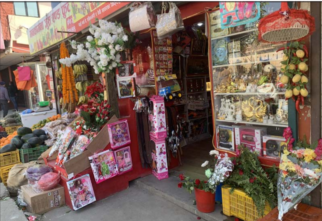
प्रेम विवसः काठमाडौं नयाँ बानेश्वरमा प्रेम विवसलाई लभित गरी बिक्रीको लागि राखिएका पोस्टकार्ड र गुलाबका फूल।

संविधान अनुसार यातायातसम्बन्धी जिम्मेवारी सङ्घ र प्रदेशमा बाँडिएपछि कार्यालयहरू नेपाल सरकारले प्रदेश सरकारलाई हस्तान्तरण गरेको थियो।