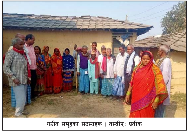
गठित समूहका सदस्यहरू।

छुवाछूत, सामाजिक विभेद, अन्याय, अत्याचार, दमन, शोषण, असमानता कायम नै रहेको बताएको छ। गाउँपालिका र वडाले अहिलेसम्म दलित समुदायको लागि खासै केही नगरेको