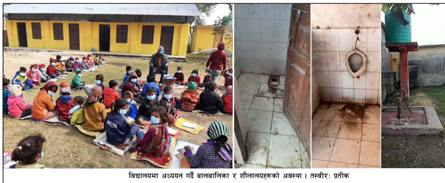
विद्यालयमा अध्ययन गर्दै बालबालिका र शौचालयहरूको अवस्था ।

गर्नुपर्ने बताए । उनले सामुदायिक विद्यालयहरूमा युनिसेफको सहयोगमा निर्मित विद्यालयहरू मात्र बालमैत्री र सफाइयुक्त शौचालय रहेको र तीबाहेकका विद्यालयहरूमा बालमैत्री शौचालय नभएको बताए ।