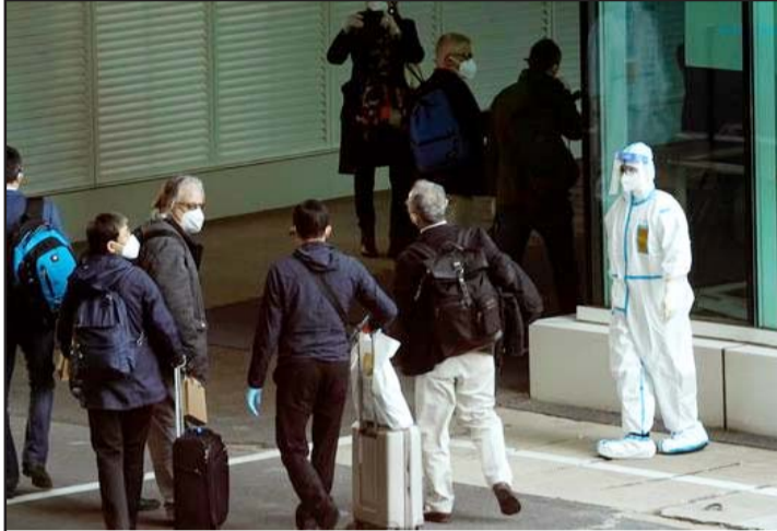
चीनको वुहानमा विश्व स्वास्थ्य सङ्गठनका विशेषज्ञ अधिकारीहरू।

विश्व स्वास्थ्य सङ्गठनको टोमले वुहान शहरमा रहेको वुहान इन्टिच्युट अफ भाइरोलोजीको अध्यक्षन गरेका थिए र उनीहरूले सो संस्थाको ल्याबको पनि अनुसन्धान गरेका थिए। रासस