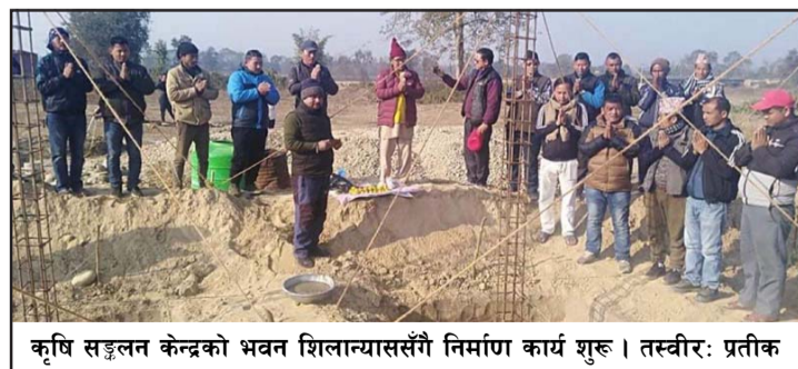
कृषि सङ्कलन केन्द्रको भवन शिलान्याससँगै निर्माण कार्य शुरू ।

अगाडि बढाउन गापाले ल्याएका कार्यक्रमहरूको चर्चा गर्दै उनले कृषकको लागि पालिकाले सबैखाले सहयोग गर्ने आशवासन दिए ।