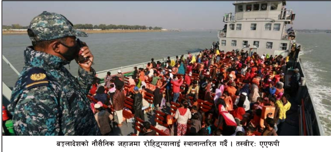
बङ्गलादेशको नौसैनिक जहाजमा रोहिङ्गालाई स्थानान्तरित गर्दै।

रोहिङ्गा समुदायको पलायन रोक्ने विषयमा बङ्गलादेश दीर्घकालीन समाधान