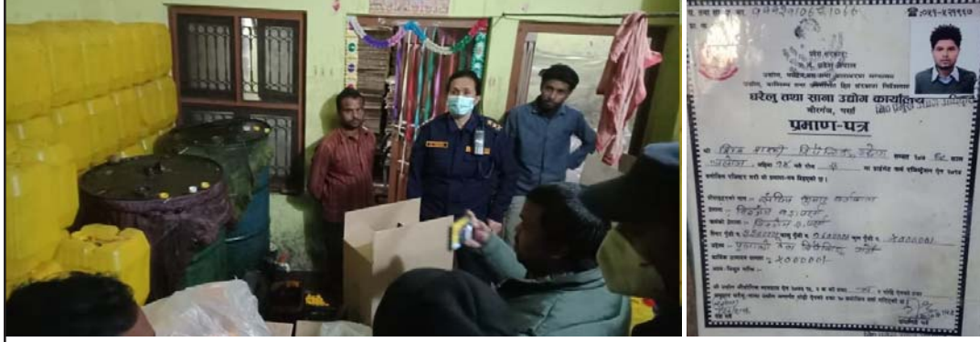
छापामारी गर्दै प्रउ पन्तसहितको टोली र उद्योगलाई जारी भएको प्रमाणपत्र।

उक्त उद्योगमा रिफाइन तेल बाहिरबाट ल्याएर केमिकल प्रयोग गरी त्यसलाई तिलको तेल बनाएर प्याकिड गरी बिक्री गरिरहेको भन्ने सूचनाको आधारमा प्रहरीले छापा मारेको हो।