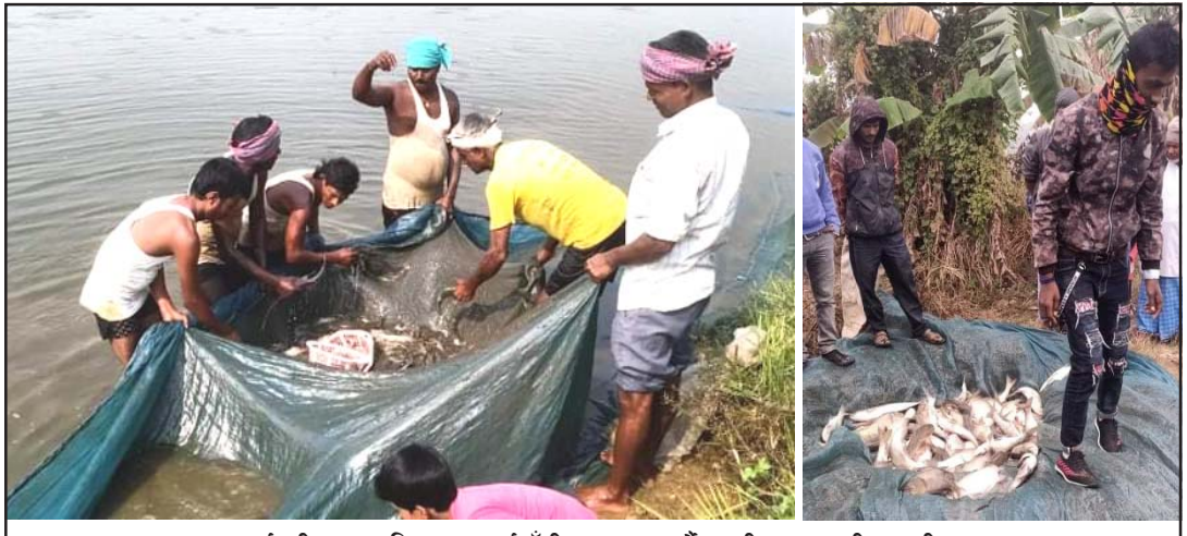
पसागढी नगरपालिका-९ बर्वाटौडीमा माछा माई माझीहरू ।

सहनी बताउँछन् । जाडोयाममा पोखरीमा पस्त समस्या हुने भएपनि पोखरीको तल