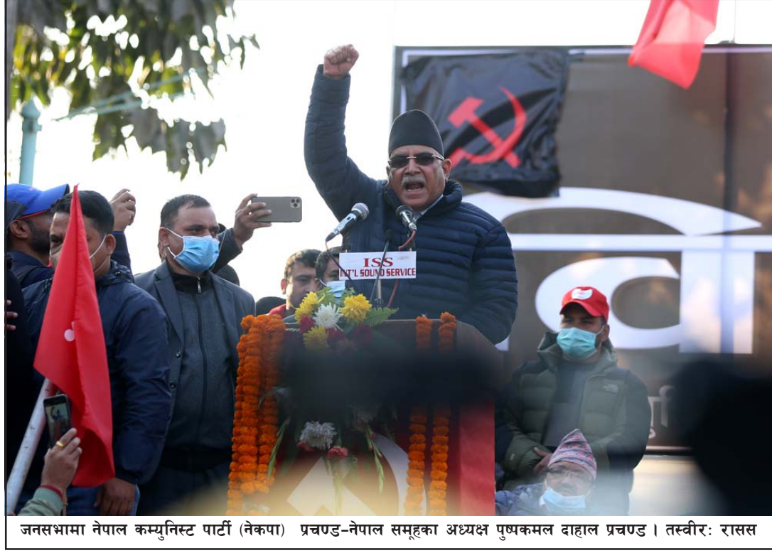
जनसभामा नेपाल कम्युनिस्ट पार्टी (नेकपा) प्रचण्ड-नेपाल समूहका अध्यक्ष पुष्पकमल दाहाल प्रचण्ड।