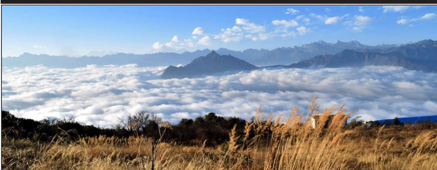
हिमशृङ्खलासहित रमणीय दृश्यः ताप्लेजुडमा अवस्थित प्रसिद्ध तीर्थस्थल पाथीभरा मन्दिर परिसरबाट देखिएको हिमशृङ्खलासहित रमणीय दृश्य।